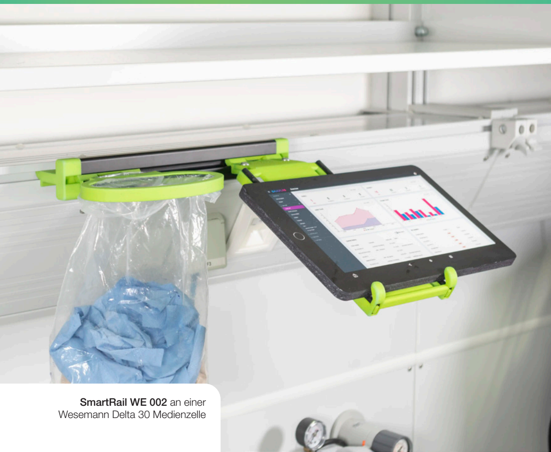
SmartRail WE 002 an einer Wesemann Delta 30 Medienzelle