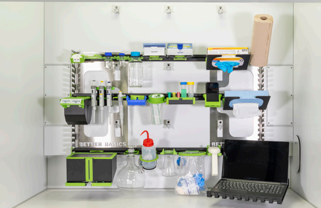
SmartEdge elite WE 001 in einem Wesemann Delta 30 Laborabzug