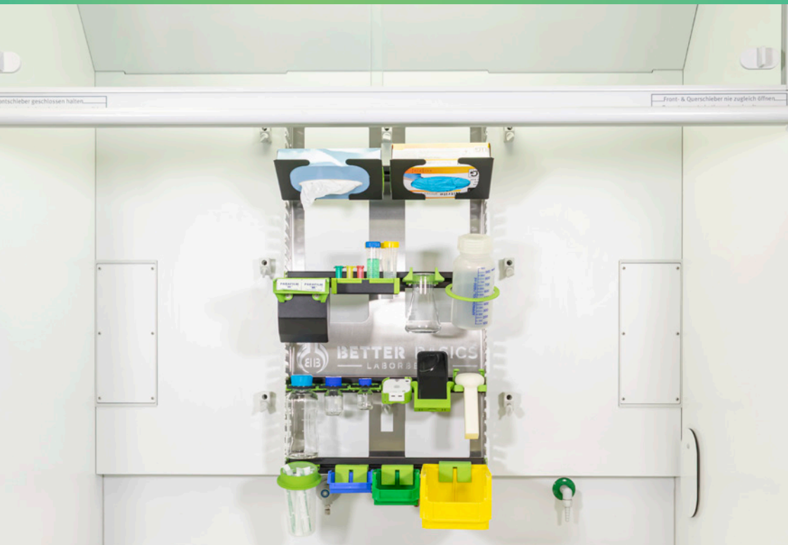
SmartFrame elite WE 002 in einem Wesemann Delta 30 Laborabzug